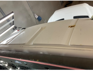
Tavan, Tavan > Pas