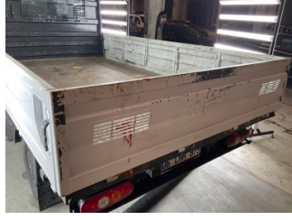
Kaporta, Kaporta > Ezik