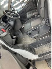
Döşemeler/Kapaklar, Döşemeler/Kapaklar > Çizik