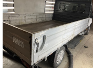
Kaporta, Kaporta > Ezik