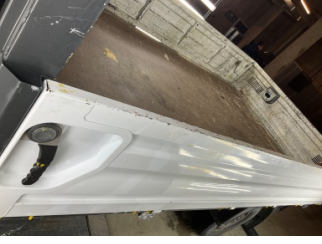
Kaporta, Kaporta > Ezik