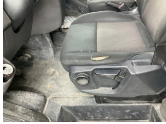
Döşemeler/Kapaklar, Döşemeler/Kapaklar > Hasarlı