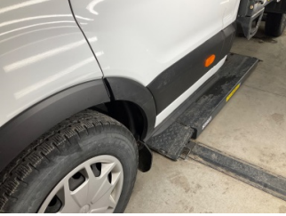
Kapı, sol ön, Kapı bandı > Çizik