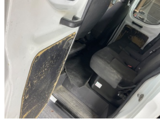
Döşemeler/Kapaklar, Döşemeler/Kapaklar > Hasarlı