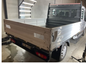
Kaporta, Kaporta > Boyası Atmış