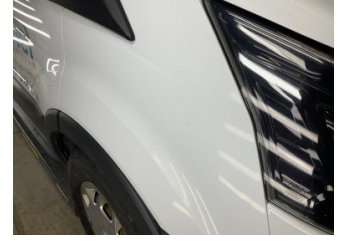
Kaporta, Kaporta > Boyası Atmış