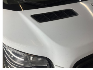
Kaporta, Kaporta > Boyası Atmış