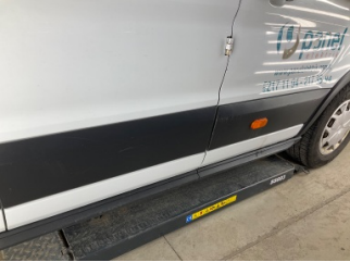
Kapı, sağ ön, Kapı bandı > Çizik