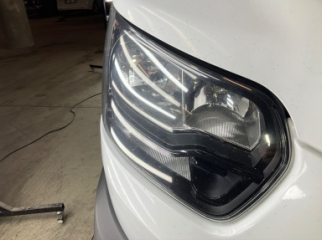
Farlar, Far camı, sağ > Taş lzi