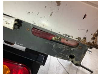
Tampon, arka, Reflektör, sağ > Hasarlı