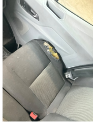
Döşemeler/Kapaklar, Döşemeler/Kapaklar > Hasarlı