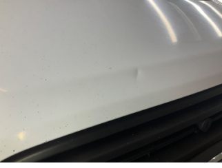
Motor, Motor > Vuruk