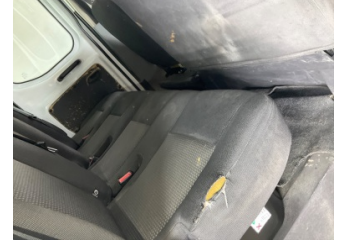
Döşemeler/Kapaklar, Döşemeler/Kapaklar > Hasarlı