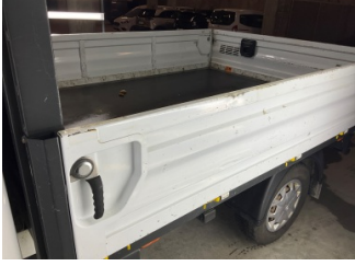
Kaporta, Kaporta > Boyası Atmış