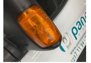
Dikiz aynası, sol, Sinyal lambası > Hasarlı