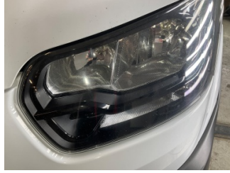
Farlar, Far camı, sol > Taş lzi