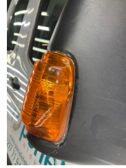
Dikiz aynası, sağ, Dış dikiz aynası kapağı > Standart Dışı Onarım