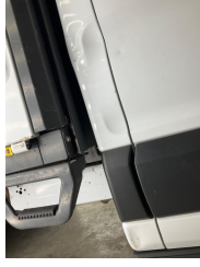
Kaporta, B-direk, sağ > Ezik