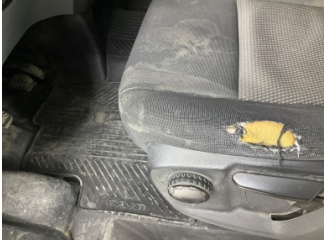
Döşemeler/Kapaklar, Döşemeler/Kapaklar > Hasarlı