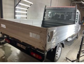
Kaporta, Kaporta > Ezik