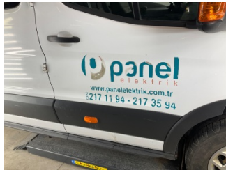
Kaporta, Kaporta > Etiket Yapıştırılmış