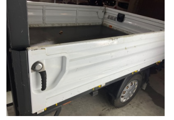
Kaporta, Kaporta > Ezik