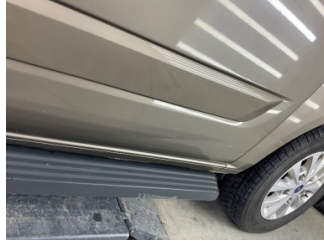
Kapı, sol arka, Kapı, sol arka > Çizik