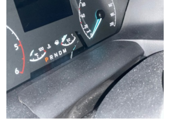
Pano/Göstergeler, Pano/Göstergeler > Çatlak