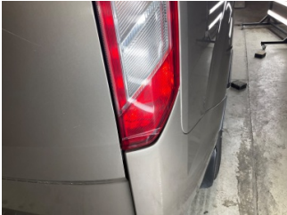
Arka lambalar, Arka lamba camı, sağ > Çizik