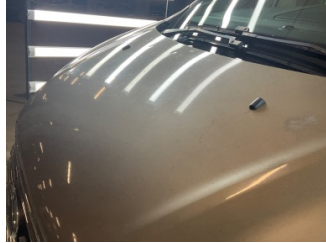
Kaporta, Kaporta > Dolu Hasarı