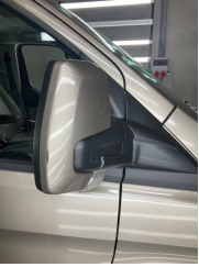
Dikiz aynası, sağ, Dış dikiz aynası kapağı > Çizik