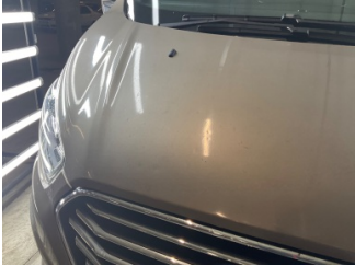
Motor kaputu, Motor kaputu > Yakıcı Madde Ile Zarar Görmüş