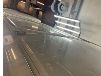
Kaporta, Kaporta > Dolu Hasarı