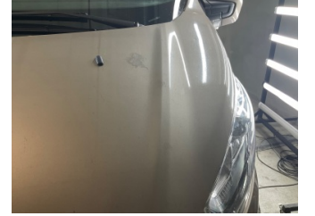
Motor kaputu, Motor kaputu > Yakıcı Madde Ile Zarar Görmüş