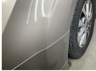
Çamurluk, sol, Çamurluk, sol > Rötüş