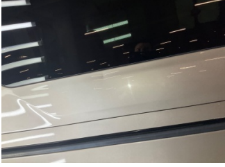
Çamurluk, sağ arka, Çamurluk, sağ arka > Küçük Vuruk

Sayfa: 11/12 Araç Çıkış Tarihi: 06.04.2026 12:28