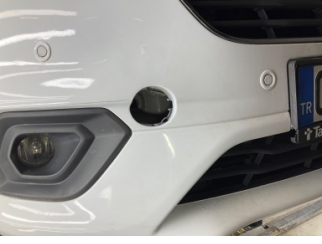
Tampon, ön, Çeki demir kapağı > Sökülmüş-Yok