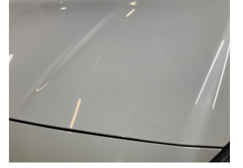
Motor kaputu, Motor kaputu > Taş izi