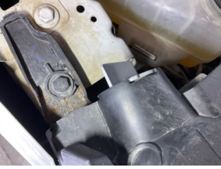
Farlar, Far bağlantı ayağı, sağ > Standart Dışı Onarım