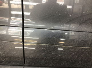
Kapı, sağ ön, Kapı, sağ ön > Çizik