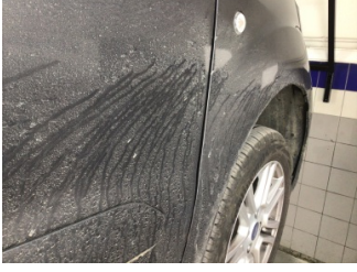
Çamurluk, sağ, Çamurluk, sağ > Ayarsız