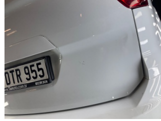
Bagaj kapağı/kapısı, Bagaj kapısı > Küçük Çizik