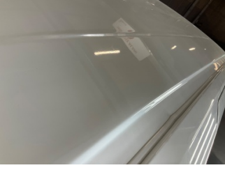
Tavan, Tavan > Vuruk