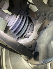
Ön aks, Aks mili, sağ > Yağ Kaçağı