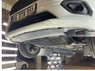
Tampon, ön, Spoiler > Eksik