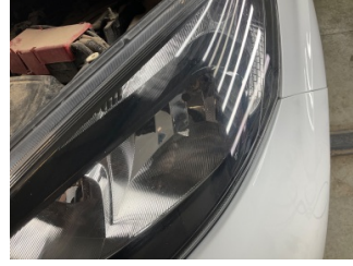
Farlar, Far camı, sol > Taş Vuruğu