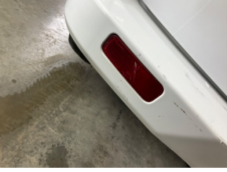
Tampon, arka, Reflektör, sol > Hasarlı