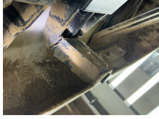
Tampon, arka, Bağlantı ayağı > Kırılmış