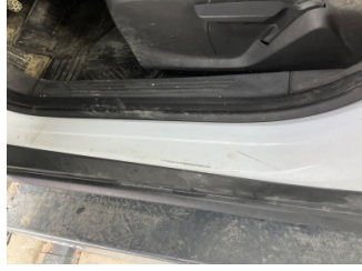
Marşbiyel, sol, Marşbiyel, sol > Boyası Atmış