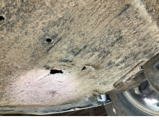
Motor, Alt muhafaza > Delinmiş