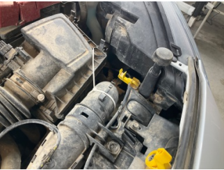
Motor, Hava filtresi kabı > Standart Dışı Onarım