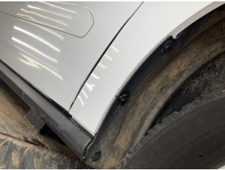
Çamurluk, sağ, Çamurluk, sağ > Vuruk