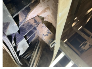
Tampon, arka, Bağlantı ayağı > Kırılmış