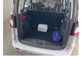
Döşemeler/Kapaklar, Pandizot > Sökülmüş-Yok