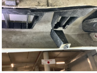
Tampon, arka, Bağlantı ayağı > Kırılmış