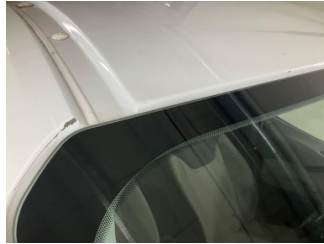
Kaporta, Sağ Üst Frangart > Boyası Atmış