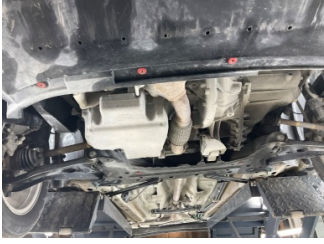
Motor, Alt muhafaza > Sökülmüş-Yok