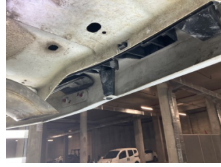
Tampon, arka, Bağlantı ayağı > Kırılmış