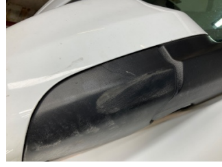
Dikiz aynası, sağ, Dış dikiz aynası bağlantısı > Kırılmış