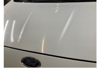
Kaporta, Kaporta > Taş Izi