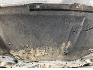
Motor, Alt muhafaza > Deforme Olmuş