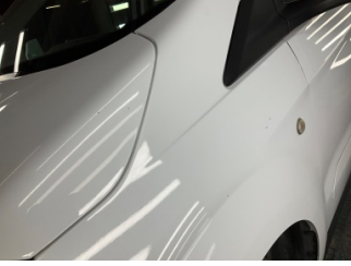
Kaporta, Kaporta > Taş Izi