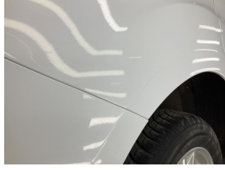
Çamurluk, sağ arka, Çamurluk, sağ arka > Küçük Çizik