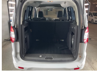
Döşemeler/Kapaklar, Pandizot > Sökülmüş-Yok