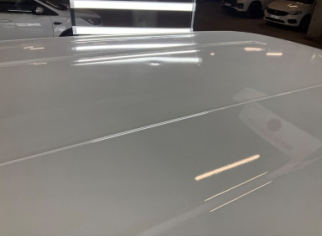
Tavan, Tavan > Noktasal Ezik