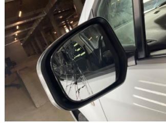
Dikiz aynası, sol, Ayna camı > Hasarlı