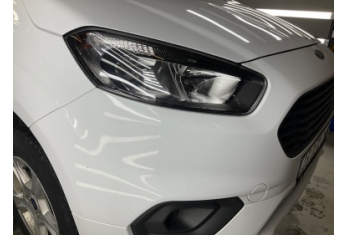
Kaporta, Kaporta > Taş Izi