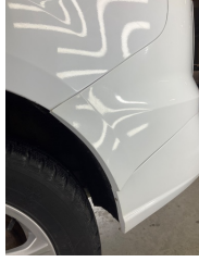
Tampon, arka, Arka tampon > Sabitlemesi Hatalı