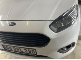
Kaporta, Kaporta > Taş Izi