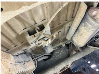
Dokümantasyon ve Ekipmanlar, İstapne > Sökülmüş-Yok