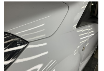
Çamurluk, sol, Çamurluk, sol > Noktasal Ezik