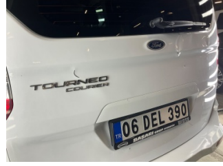
Bagaj kapağı/kapısı, Bagaj kapısı > Hasarlı