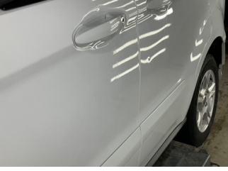
Kapı, sol arka, Kapı, sol arka > Noktasal Ezik

Sayfa: 9/10 Araç Çıkış Tarihi: 08.05.2026 12:58