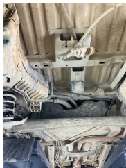
Kaporta, Araç gövdesi altı, ön > Kirlenmiş