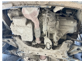
Kaporta, Araç gövdesi altı, ön > Kirlenmiş