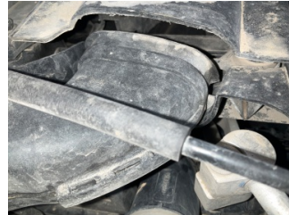
Motor, Hava filtresi kabı > Kırılmış