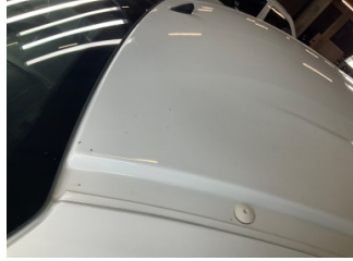
Kaporta, Kaporta > Taş Izi