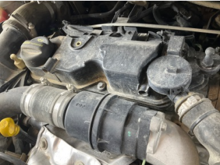
Motor, Motor üst kapağı, plastik > Sökülmüş-Yok