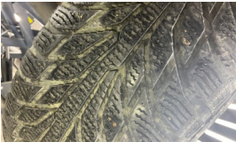
Lastik, sağ arka > Delinmiş