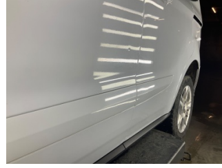
Kapı, sol ön, Kapı, sol ön > Noktasal Ezik