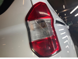
Arka lambalar, Arka lamba camı, sağ > Hasarlı