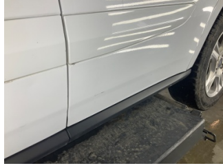
Kapı, sol arka, Kapı, sol arka > Küçük Çizik