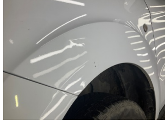
Çamurluk, sol, Çamurluk, sol > Ezik