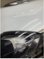
Farlar, Far camı, sağ > Küçük Çizik