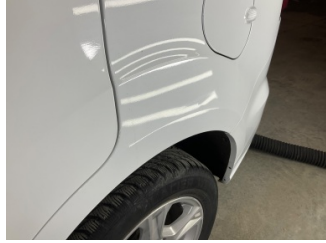
Çamurluk, sol arka, Çamurluk, sol arka > Küçük Vuruk