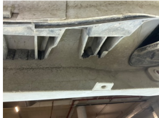
Tampon, arka, Bağlantı ayağı > Hasarlı