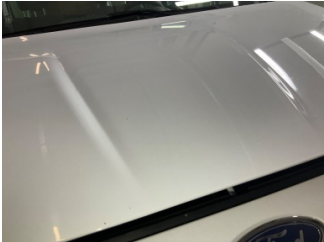
Motor kaputu, Motor kaputu > Taş İzi