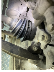
Ön aks, Aks mili, toz körüğü, sağ > Hasarlı