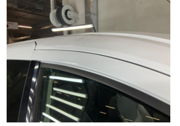
Kaporta, Sağ Üst Frangart > Ezik