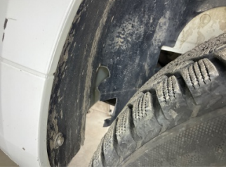
Çamurluk, sol, Davlumbaz > Hasarlı