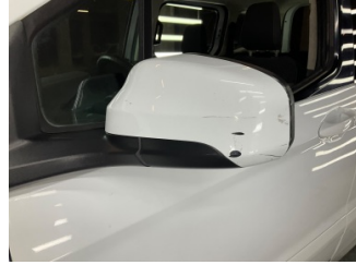
Dikiz aynası, sol, Dış dikiz aynası kapağı > Çizik