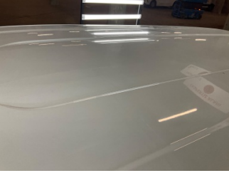
Tavan, Tavan > Noktasal Ezik