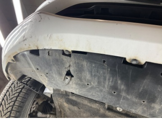
Tampon, ön, Tampon koruyucu orta > Hasarlı

Sayfa: 10/11 Araç Çıkış Tarihi: 24.03.2026 11:53