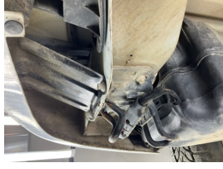
Arka bölüm, Arka sac/panel > Ezik