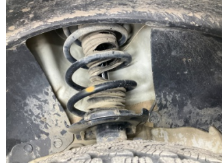
Ön aks, Amortisör körüğü, sol > Hasarlı