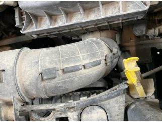
Motor, Hava filtresi kabı > Standart Dışı Onarım