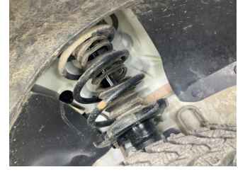
Ön aks, Amortisör körüğü, sağ > Hasarlı