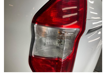
Arka lambalar, Arka lamba camı, sağ > Çatlak