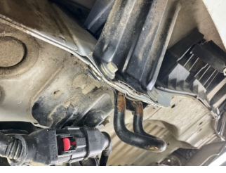
Arka bölüm, Arka sac/panel > Ezik