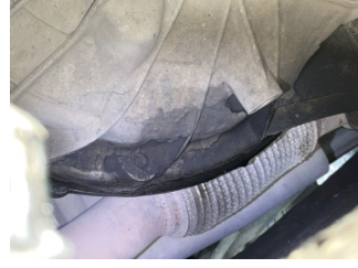
Motor, Motor > Yağ Kaçağı