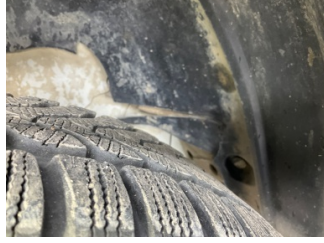
Çamurluk, sol, Davlumbaz > Hasarlı