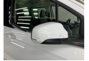
Dikiz aynası, sağ, Dış dikiz aynası kapağı > Çizik