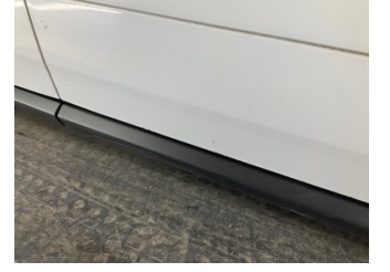
Kaporta, Kaporta > Taş Izi