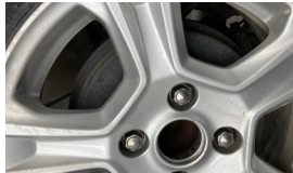
Jant göbeği kapağı, arka sağ > Sökülmüş-Yok