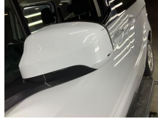
Dikiz aynası, sol, Dış dikiz aynası kapağı > Çizik