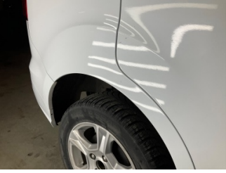
Kaporta, Kaporta > Taş Izi