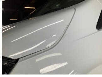
Motor kaputu, Motor kaputu > Boyası Atmış