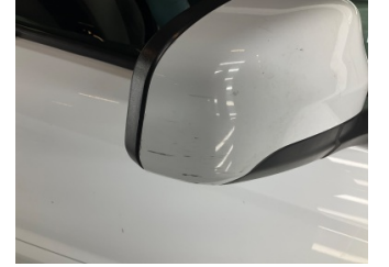
Dikiz aynası, sağ, Dış dikiz aynası kapağı > Çizik