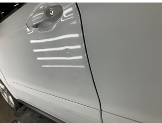
Kapı, sol ön, Kapı, sol ön > Eziz