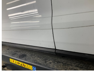
Kaporta, Kaporta > Taş Izi