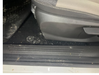
Döşemeler/Kapaklar, Döşemeler/Kapaklar > Yakıcı Madde Ile Zarar Görmüş