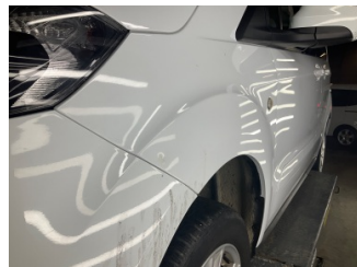
Çamurluk, sol, Çamurluk, sol > Ezik