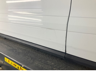
Kapı, sol ön, Kapı, sol ön > Boyası Atmış