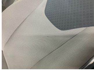
Döşemeler/Kapaklar, Döşemeler/Kapaklar > Yakıcı Madde Ile Zarar Görmüş