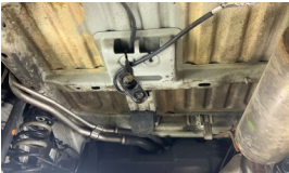
Stepne > Sökülmüş-Yok