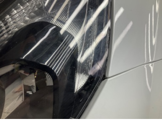
Farlar, Far camı, sol > Çatlak