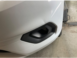
Tampon, ön, Ön tampon > Ezik