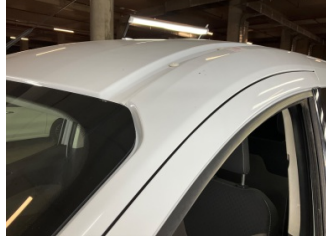
Kaporta, Kaporta > Taş Izi