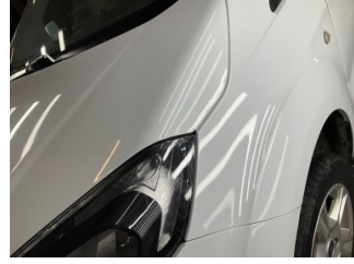
Kaporta, Kaporta > Taş Izi