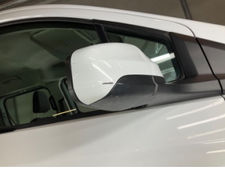
Dikiz aynası, sağ, Dış dikiz aynası kapağı > Çizik