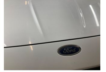
Kaporta, Kaporta > Taş Izi