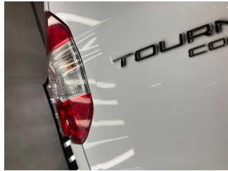
Bagaj kapağı/kapısı, Bagaj kapısı > Vuruk