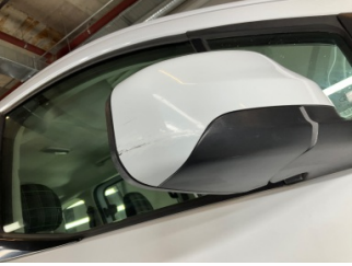
Dikiz aynası, sağ, Dış dikiz aynası kapağı > Çizik