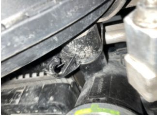
Motorsoğutması, Fan muhafazası > Sabitlemesi Hatalı