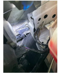
Çamurluk, sağ, Bağlantı ayağı > Ezik