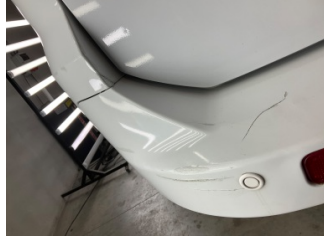
Tampon, arka, Arka tampon > Kırılmış