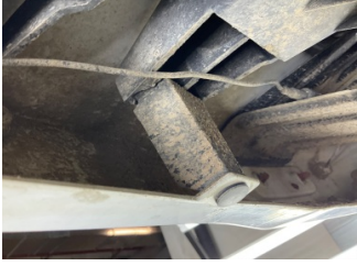
Tampon, arka, Bağlantı ayağı > Kırılmış