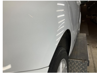
Çamurluk, sağ arka, Çamurluk, sağ arka > Vuruk