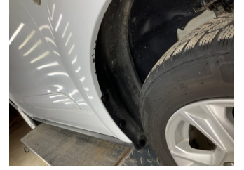
Çamurluk, sağ, Çamurluk, sağ > Boyası Atmış