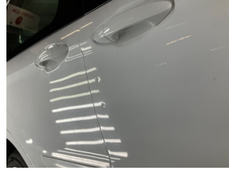
Kapı, sağ ön, Kapı, sağ ön > Noktasal Ezik