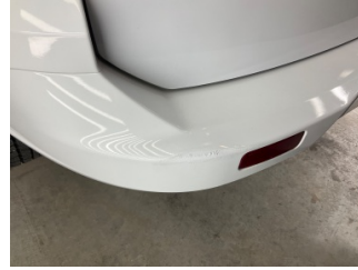
Tampon, arka, Arka tampon > Rötüş