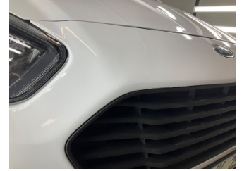
Tampon, ön, Ön tampon > Boyası Atmış