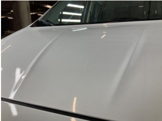
Motor kaputu, Motor kaputu > Taş İzi