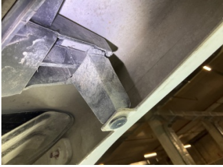
Tampon, arka, Bağlantı ayağı > Kırılmış