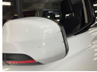
Dikiz aynası, sol, Dış dikiz aynası kapağı > Küçük Çizik