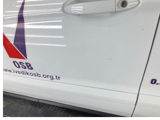
Kapı, sol ön, Kapı, sol ön > Küçük Çizik