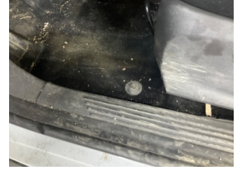
Taban, Taban halısı > Yakıcı Madde ile Zarar Görmüş