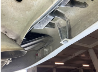
Tampon, arka, Bağlantı ayağı > Hasarlı