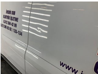
Kapı, sağ ön, Kapı, sağ ön > Eziz