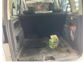
Döşemeler/Kapaklar, Pandizot > Sökülmüş-Yok