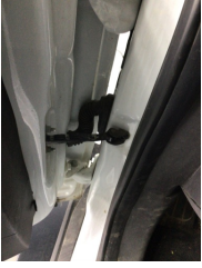
Kapı, sol ön, Kapı gergisi > Ses Yapıyor

Sayfa: 1/1 Araç Çıkış Tarihi: 22.10.2024 10:20