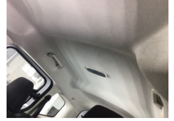
Döşemeler/Kapaklar, Tavan döşemesi > Kirlenmiş