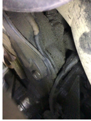
Motor, Motor üst kapağı, plastik > Yağ Kaçağı