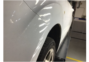
Tampon, ön, Ön tampon > Standart Dışı Onarım