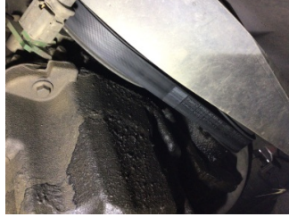
Motor, Triger zinciri kapağı > Yağ Kaçağı