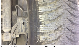
Lastik, arka > Deforme Olmuş