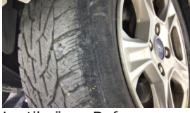
Lastik, ön > Deforme Olmuş