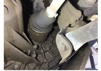
Şanzıman, Kardan mili, ön aks > Yağ Kaçağı