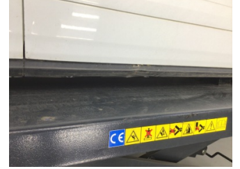
Marşbiyel, sağ, Marşbiyel plastiği, sağ > Hasarlı