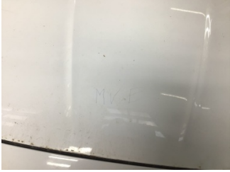
Motor kaputu, Motor kaputu > Çizik