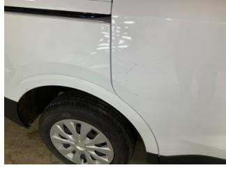
Kapı, sağ arka, Kapı, sağ arka > Yüzeysel Çizik