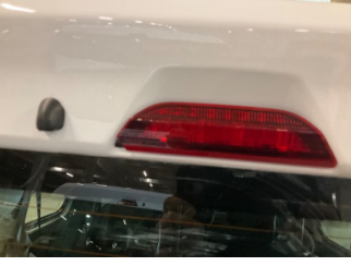
Arka lambalar, Üçüncü fren lambası > Kırılmış