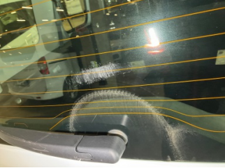
Camlar, Arka cam > Çizik