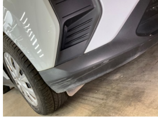
Tampon, ön, Spoyler > Çizik