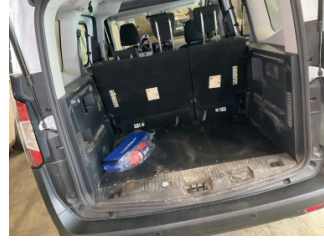
Döşemeler/Kapaklar, Pandizot > Sökülmüş-Yok