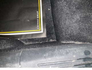
Taban, Taban halısı > Yakıcı Madde ile Zarar Görmüş