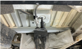
Stepne > Sökülmüş-Yok