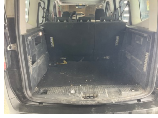
Döşemeler/Kapaklar, Pandizot > Sökülmüş-Yok