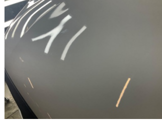
Motor kaputu, Motor kaputu > Yakıcı Madde İle Zarar Görmüş