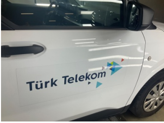
Kapı, sağ ön, Kapı, sağ > Etiket Yapıştırılmış