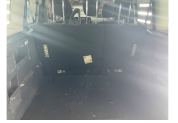
Döşemeler/Kapaklar, Pandizot > Sökülmüş-Yok