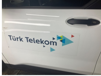
Kapı, sol ön, Kapı, sol > Etiket Yapıştırılmış