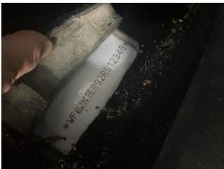
Kaporta, Kaporta > Onaysız