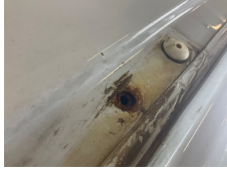
Tavan, Tavan > Pas