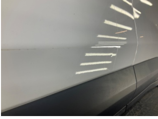
Kapı, sol ön, Kapı, sol > Noktasal Ezik