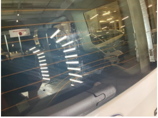
Camlar, Arka cam > Çizik