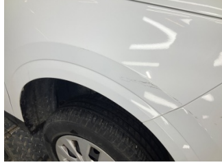
Çamurluk, sağ, Çamurluk, sağ > Yüzeysel Çizik