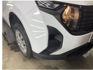
Tampon, ön, Ön tampon > Ezik