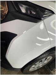
Tampon, ön, Ön tampon > Ezik