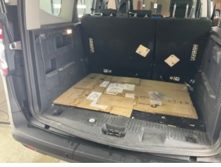
Döşemeler/Kapaklar, Pandizot > Sökülmüş-Yok