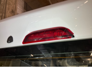
Arka lambalar, Üçüncü fren lambası > Hasarlı