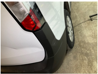
Çamurluk, sağ arka, Çamurluk, sağ arka > Vuruk