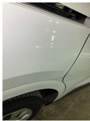
Çamurluk, sağ arka, Çamurluk, sağ arka > Vuruk