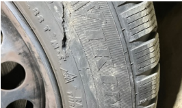
Lastik, sol ön > Hasarlı