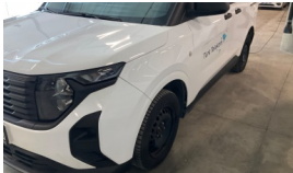
Jant kapağı seti > Eksik