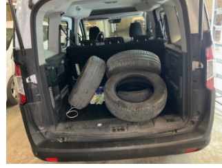
Döşemeler/Kapaklar, Pandizot > Sökülmüş-Yok