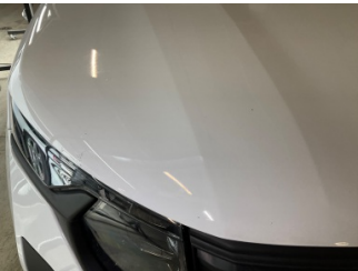
Motor kaputu, Motor kaputu > Taş Izı