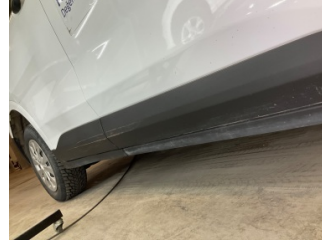
Kapı, sağ arka, Kapı bandı > Çizik