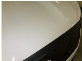
Motor kaputu, Motor kaputu > Taş Izı