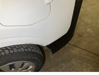
Çamurluk, sol arka, Çamurluk, sol arka > Vuruk