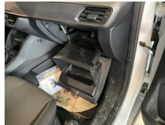
Pano/Göstergeler, Torpido gözükapağı > Kırılmış