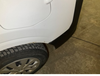
Tampon, arka, Arka tampon > Sabitlemesi Hatalı