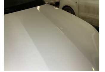
Motor kaputu, Motor kaputu > Yakıcı Madde Ile Zarar Görmüş