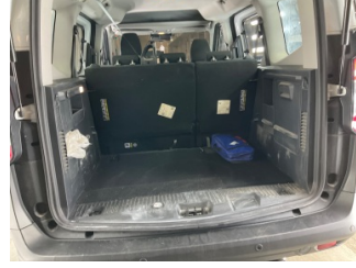
Döşemeler/Kapaklar, Pandizot > Sökülmüş-Yok