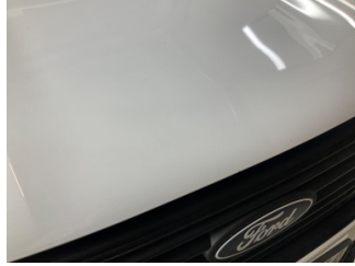
Motor kaputu, Motor kaputu > Taş lzi