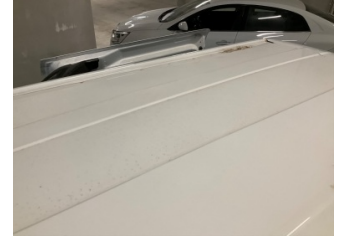
Tavan, Tavan > Hasarlı