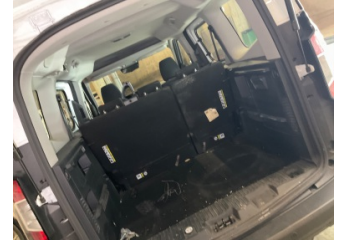
Döşemeler/Kapaklar, Pandizot > Sökülmüş-Yok