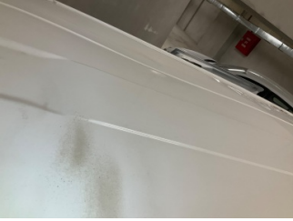
Tavan, Tavan > Hasarlı