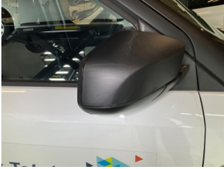
Dikiz aynası, sağ, Dış dikiz aynası kapağı > Çizik