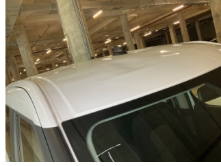
Tavan, Tavan > Hasarlı