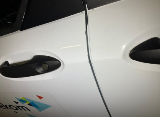
Kapı, sol ön, Kapı, sol ön > Boyası Atmış