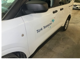
Kaporta, Kaporta > Etiket Yapıştırılmış