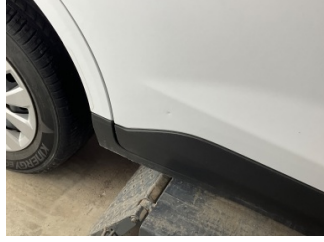
Kapı, sağ arka, Kapı, sağ arka > Noktasal Ezik