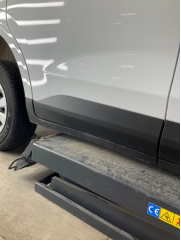
Marşbiyel, sağ, Marşbiyel plastiği, sağ > Çizik