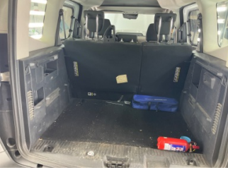
Döşemeler/Kapaklar, Pandizot > Sökülmüş-Yok