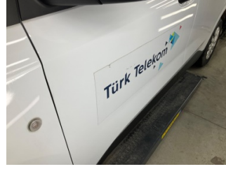
Kaporta, Kaporta > Etiket Yapıştırılmış