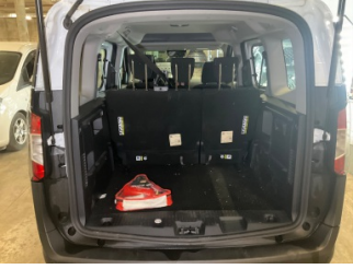
Döşemeler/Kapaklar, Pandizot > Sökülmüş-Yok