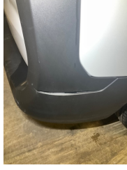
Tampon, arka, Arka tampon > Sabitlemesi Hatalı