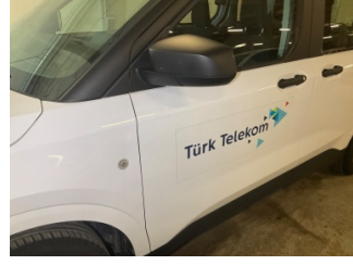
Kaporta, Kaporta > Etiket Yapıştırılmış