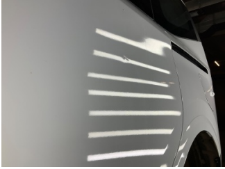
Kapı, sol ön, Kapı, sol ön > Noktasal Ezik