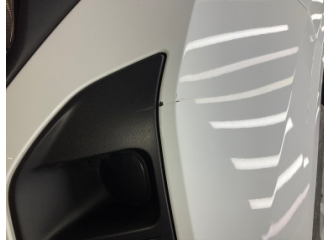
Tampon, ön, Ön tampon > Küçük Çizik