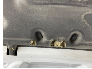
Motor kaputu, İzolasyon döşemesi > Hasarlı