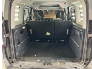
Döşemeler/Kapaklar, Pandizot > Sökülmüş-Yok