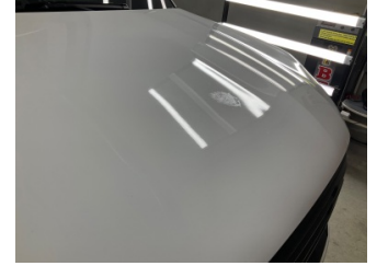
Motor kaputu, Motor kaputu > Yakıcı Madde Ile Zarar Görmüş