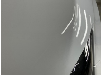
Motor kaputu, Motor kaputu > Taş İzi