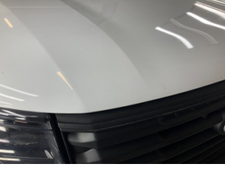
Motor kaputu, Motor kaputu > Taş izi