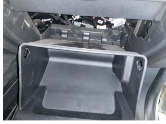
Pano/Göstergeler, Torpido gözü kapağı > Sabitlemesi Hatalı