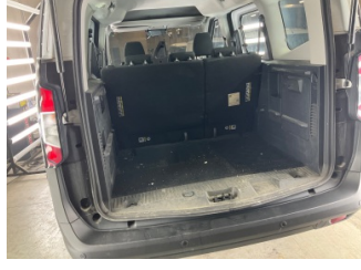
Döşemeler/Kapaklar, Pandizot > Sökülmüş-Yok