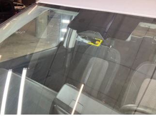
Camlar, Ön cam > Hasarlı