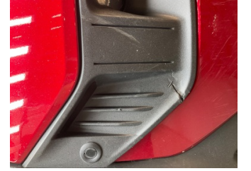
Sis lambaları, Sis Izgarası Sağ > Hasarlı