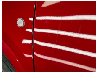
Kapı, sol ön, Kapı, sol > Taş Izi