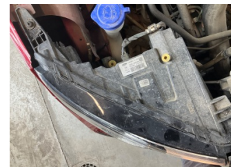
Farlar, Far bağlantı ayağı, sağ > Standart Dışı Onarım