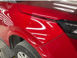
Çamurluk, sağ, Çamurluk, sağ > Taş Izi