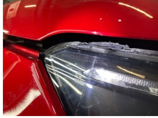
Farlar, Far camı, sağ > Standart Dışı Onarım