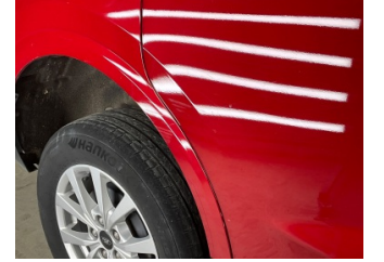
Kapı, sağ arka, Sürgülü kapı, sağ arka > Çizik