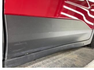
Kapı, sol arka, Nikelaj, alt > Çizik