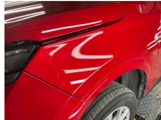
Çamurluk, sol, Çamurluk, sol > Taş Izi