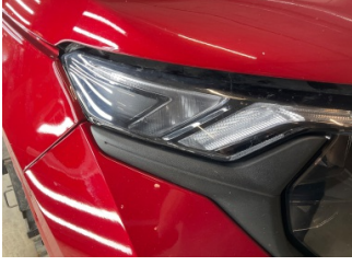
Farlar, Far camı, sağ > Çizik

Sayfa: 10/13 Araç Çıkış Tarihi: 29.06.2026 17:38