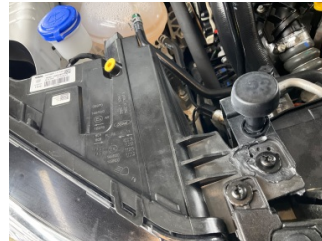
Farlar, Far bağlantı ayağı, sağ > Standart Dışı Onarım