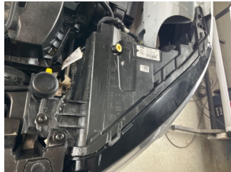
Farlar, Far bağlantı ayağı, sol > Standart Dışı Onarım