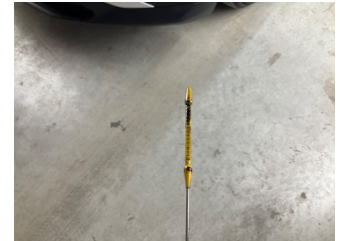
Motor, Yağ seviyesi > Eksik