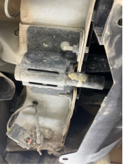
Arka bölüm, Arka sac/panel > Ezik