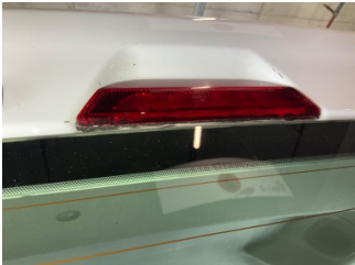
Arka lambalar, Üçüncü fren lambası > Çatlak