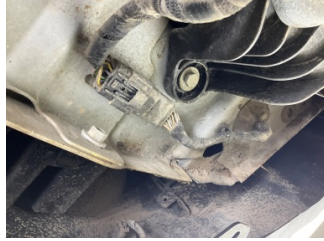
Arka bölüm, Arka sac/panel > Ezik