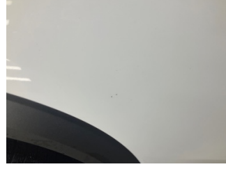
Kapı, sağ arka, Kapı, sağ arka > Taş Izi