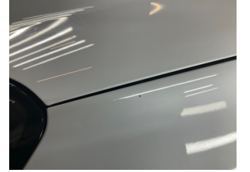
Çamurluk, sol, Çamurluk, sol > Taş Izi