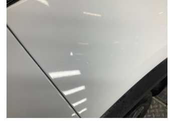
Çamurluk, sağ arka, Çamurluk, sağ arka > Rötüş