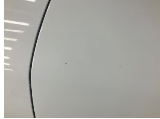
Kapı, sol arka, Kapı, sol arka > Taş Izi