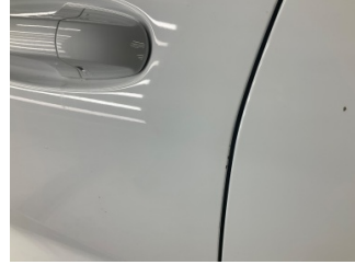
Kapı, sol ön, Kapı, sol > Taş Izi