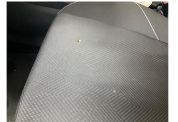
Koltuklar, ön, Koltuk, sol ön > Yakıcı Madde Ile Zarar Görmüş