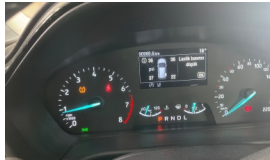
Tekerlek/Lastik > Uyarı Lambası Yanıyor