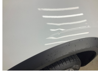
Çamurluk, sağ, Çamurluk, sağ > Noktasal Ezik