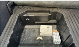
Stepne > Eksik