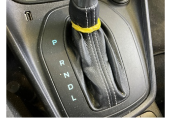
Şanzıman, Vites körüğü > Deforme Olmuş