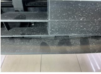
Tampon, ön, Spoiler > Sabitlemesi Hatalı

Sayfa: 9/10 Araç Çıkış Tarihi: 20.05.2026 13:16