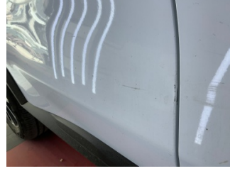
Kapı, sağ arka, Kapı, sağ arka > Boyası Atmış