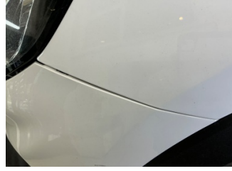
Tampon, ön, Ön tampon > Sabitlemesi Hatalı