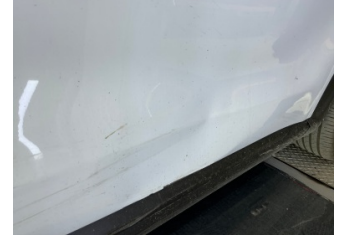
Kapı, sağ ön, Kapı, sağ ön > Hasarlı