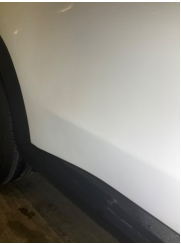
Kapı, sağ arka, Kapı, sağ arka > Vuruk