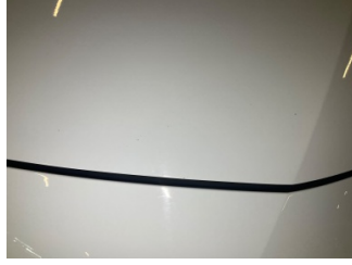
Motor kaputu, Motor kaputu > Taş izi