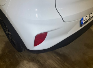
Tampon, arka, Arka tampon > Küçük Çizik