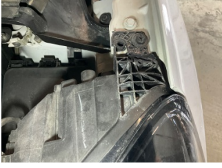
Farlar, Far bağlantı ayağı, sol > Standart Dışı Onarım