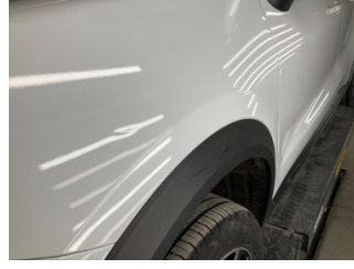
Çamurluk, sol, Çamurluk, sol > Küçük Vuruk