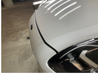
Tampon, ön, Ön tampon > Sabitlemesi Hatalı