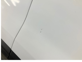
Kapı, sağ ön, Kapı, sağ ön > Küçük Çizik