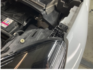
Farlar, Far bağlantı ayağı, sağ > Hasarlı