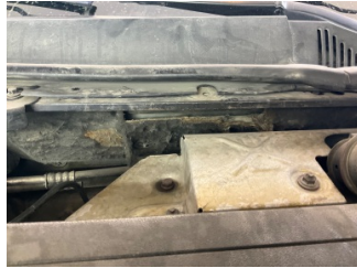
Motor kaputu, İzolasyon döşemesi > Hasarlı