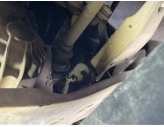
Ön aks, Aks mili, toz körüğü, sol > Yağ Kaçağı