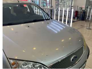
Kaporta, Kaporta > Yakıcı Madde ile Zarar Görmüş