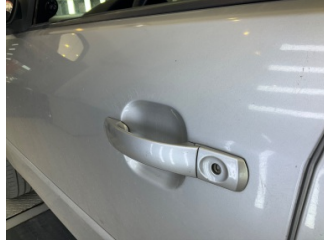
Kapı, sol ön, Kapı, sol ön > Çizik