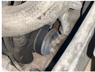
Motorsöğütması, Kayış > Çatlak