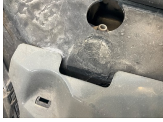
Kaporta, Ön Panel > Hasarlı