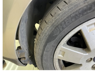
Çamurluk, sol, Davlumbaz > Hasarlı