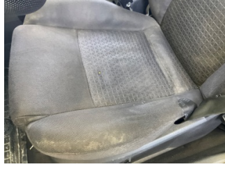
Döşemeler/Kapaklar, Döşemeler/Kapaklar > Yakıcı Madde Ile Zarar Görmüş