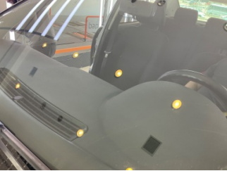
Camlar, Ön cam > Taş izi