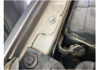
Kaporta, Sağ Kılıç Sacı > Standart Dışı Onarım