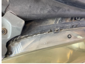
Farlar, Far camı, sol > Standart Dışı Onarım