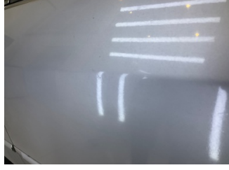
Kapı, sol arka, Kapı, sol arka > Rötüş