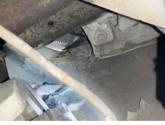
Kaporta, Sağ Podye Sacı > Standart Dışı Onarım

Sayfa: 11/15 Araç Çıkış Tarihi: 08.05.2026 12:06