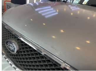
Motor kaputu, Motor kaputu > Hasarlı