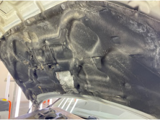
Motor kaputu, İzolasyon döşemesi > Hasarlı