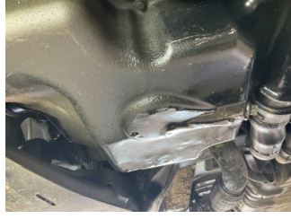
Motor, Yağ karteri > Ezik