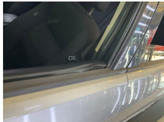
Döşemeler/Kapaklar, Döşemeler/Kapaklar > Sabitlemesi Hatalı