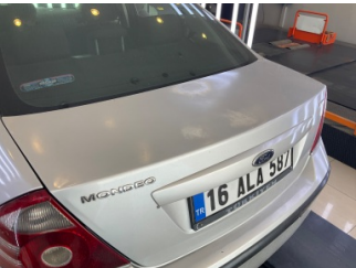
Kaporta, Kaporta > Yakıcı Madde ile Zarar Görmüş