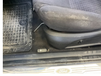
Döşemeler/Kapaklar, Döşemeler/Kapaklar > Yakıcı Madde Ile Zarar Görmüş