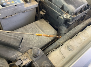
Motor, Yağ seviyesi > Eksik

Sayfa: 12/15 Araç Çıkış Tarihi: 08.05.2026 12:06