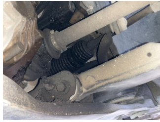
Direksiyon sistemi, Direksiyon sistemi > Yağ Kaçağı