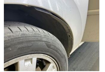
Çamurluk, sol, Davlumbaz > Hasarlı