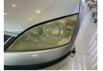
Farlar, Far camı, sol > Solmuş