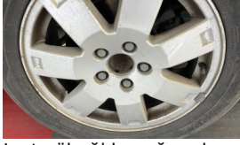
Jant gbeęi kapaęı, arka sol > Eksik