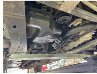
Motor, Alt muhafaza > Eksik