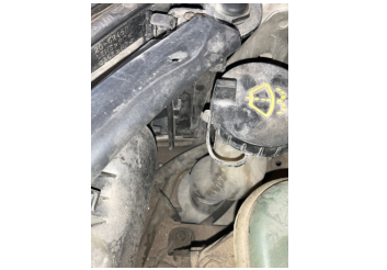
Kaporta, Sağ Podye Sacı > Standart Dışı Onarım