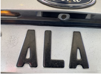
Bagaj kapağı/kapısı, Kilit mekanizması > Arızalı

Sayfa: 13/15 Araç Çıkış Tarihi: 08.05.2026 12:06