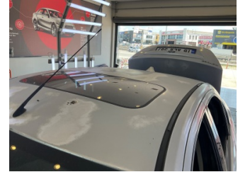
Kaporta, Kaporta > Yakıcı Madde ile Zarar Görmüş