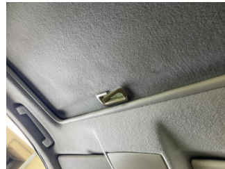
Tavan, Sunroof çerçeve/kasa > Hasarlı