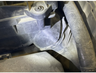
Motor, Hava filtresi kabı > Hasarlı