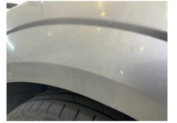
Çamurluk, sol, Çamurluk, sol > Standart Dışı Onarım