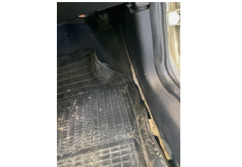
Taban, Taban halısı > Sabitlemesi Hatalı