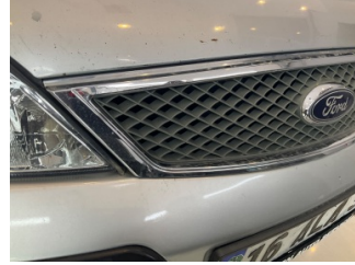
İlave parçalar, ön, Ön panjur > Sabitlemesi Hatalı