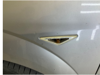
İlave sinyal lambaları, İlave sinyal lambası, sol ön > Hasarlı