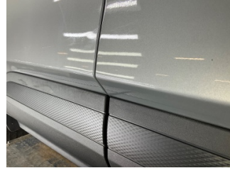
Kapı, sağ arka, Kapı, sağ arka > Yüzeysel Çizik