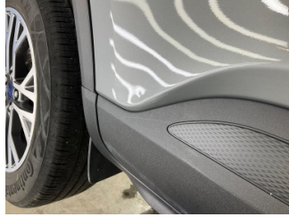
Kapı, sağ arka, Kapı, sağ arka > Vuruk