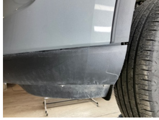
Tampon, ön, Spoiler > Sabitlemesi Hatalı