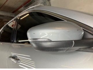
Dikiz aynası, sağ, Dış dikiz aynası kapağı > Yüzeysel Çizik