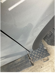
Çamurluk, sağ, Çamurluk, sağ > Vuruk