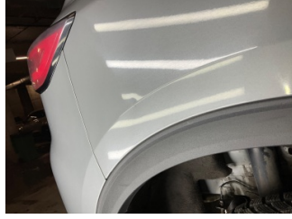
Çamurluk, sağ arka, Çamurluk, sağ arka > Noktasal Ezik