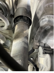
Arka aks, Amortisör, arka > Yağ Kaçağı