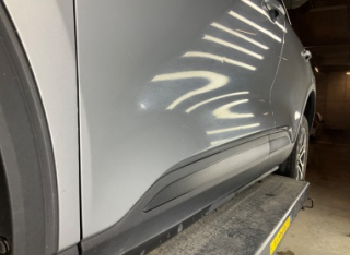
Kapı, sol ön, Kapı, sol ön > Vuruk