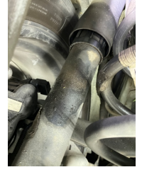
Arka aks, Amortisör, arka > Yağ Kaçağı