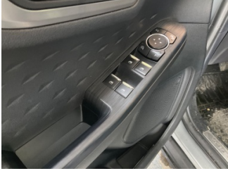
Kapı, sol ön, Cam/Ayna/Koltuk kumanda tuşları > Deforme Olmuş