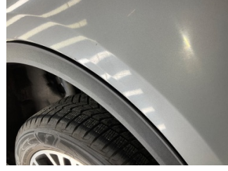
Kapı, sağ arka, Kapı, sağ arka > Vuruk