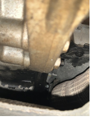
Motor, Motor > Yağ Kaçağı

Sayfa: 11/12 Araç Çıkış Tarihi: 05.05.2026 11:25