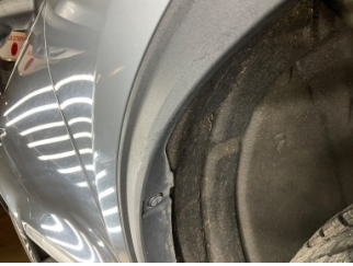
Çamurluk, sağ, Çamurluk, sağ > Çizik