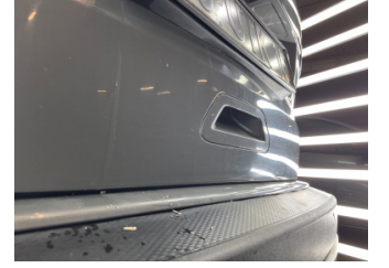
Bagaj kapağı/kapısı, Bagaj kapısı > Standart Dışı Onarım