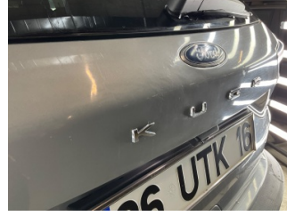
Bagaj kapağı/kapısı, Bagaj kapısı > Standart Dışı Onarım