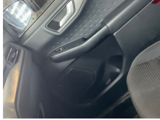
Kapı, sol ön, Cam/Ayna/Koltuk kumanda tuşları > Deforme Olmuş