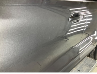
Kapı, sol ön, Kapı, sol ön > Noktasal Ezik