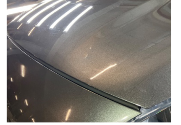
Motor kaputu, Motor kaputu > Noktasal Ezik