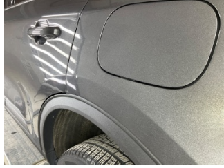
Çamurluk, sol arka, Çamurluk, sol arka > Noktasal Ezik