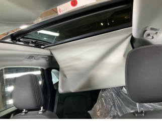
Tavan, Sunroof ilave parçalar/sabitleyici > Arızalı