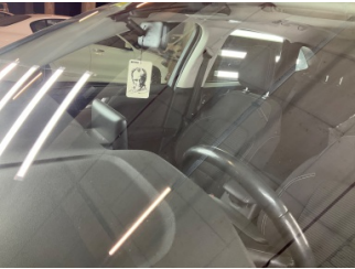
Camlar, Ön cam > Taş İzi