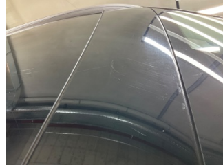
Tavan, Sunroof çerçeve/kasa > Çizik