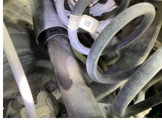
Arka aks, Amortisör, arka > Yağ Kaçağı