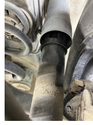
Arka aks, Amortisör, arka > Yağ Kaçağı