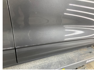
Kapı, sağ ön, Kapı, sağ ön > Yüzeysel Çizik