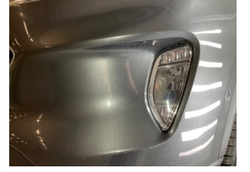
Tampon, ön, Ön tampon > Küçük Çizik