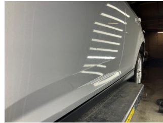
Kapı, sol ön, Kapı, sol ön > Vuruk