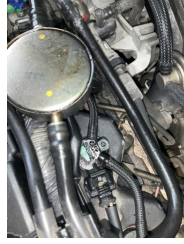
Motor, Yakıt sistemi > Sarsıyor