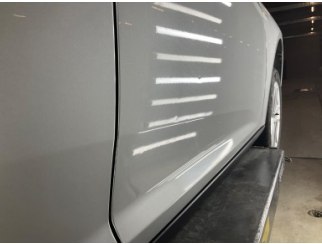
Kapı, sağ ön, Kapı, sağ ön > Vuruk