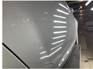
Kapı, sağ arka, Kapı, sağ arka > Vuruk