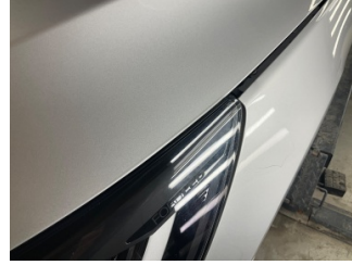
Farlar, Far, sol > Ayarsız