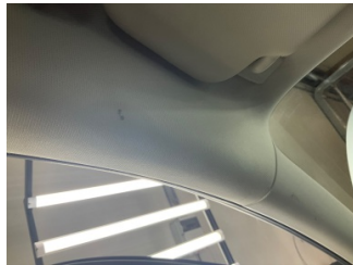
Döşemeler/Kapaklar, Döşemeler/Kapaklar > Yakıcı Madde ile Zarar Görmüş