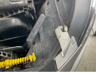
Farlar, Far bağlantı ayağı, sol > Hasarlı