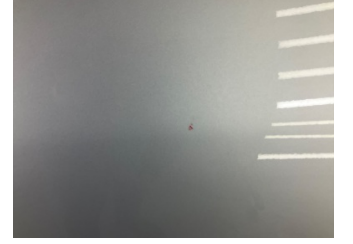
Kapı, sol arka, Kapı, sol arka > Taş Vuruğu