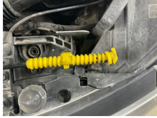
Farlar, Far bağlantı ayağı, sol > Hasarlı