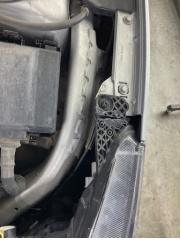
Farlar, Far bağlantı ayağı, sol > Standart Dışı Onarım