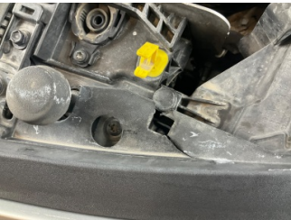
Tampon, ön, Bağlantı ayağı > Hasarlı