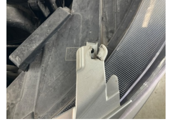
Tampon, ön, Bağlantı ayağı > Hasarlı