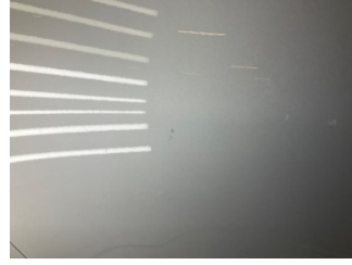
Kapı, sağ arka, Kapı, sağ arka > Yüzeysel Çizik