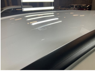
Tavan, Tavan > Yakıcı Madde İle Zarar Görmüş