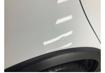
Çamurluk, sağ arka, Çamurluk, sağ arka > Noktasal Ezik