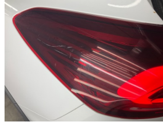
Farlar, Far camı, sol > Yüzeysel Çizik