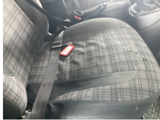
Koltuklar, ön, Koltuklar > Hasarlı