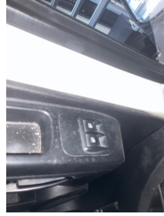
Kapı, sol ön, Cam/Ayna/Koltuk kumanda tuşları > Sabitlemesi Hatalı