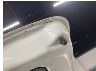
Bagaj kapağı/kapısı, Bagaj kapısı > Standart Dışı Onarım