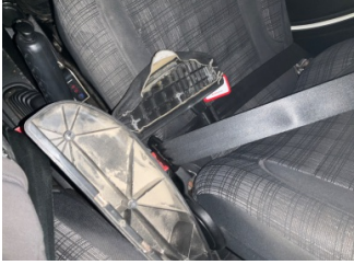
Koltuklar, ön, Kol dayaması > Hasarlı