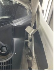
Motor kaputu, Dayama çubuğu/Amortisör > Hasarlı

Sayfa: 9/11 Araç Çıkış Tarihi: 28.04.2026 12:13