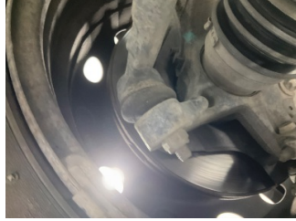
Ön aks, Denge çubuğu, bağlantı cubuğu sol > Deforme Olmuş