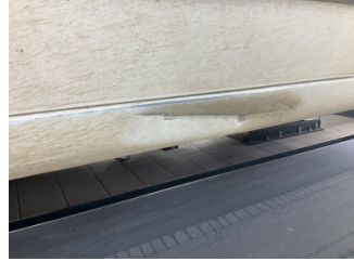
Marşbiyel, sol, Marşbiyel, sol > Hasarlı