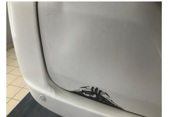
Bagaj kapağı/kapısı, Bagaj kapısı > Standart Dışı Onarım