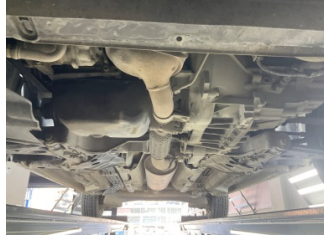
Motor, Alt muhafaza > Sökülmüş-Yok