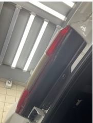
Arka lambalar, Arka lambalar, sol > Hasarlı