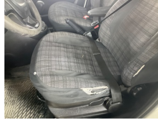
Koltuklar, ön, Koltuklar > Hasarlı