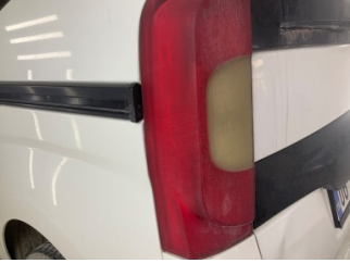
Arka lambalar, Arka lamba camı, sol > Deforme Olmuş