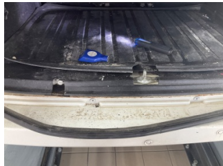
Arka bölüm, Arka sac/panel > Pas