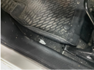
Taban, Taban halısı > Yakıcı Madde ile Zarar Görmüş