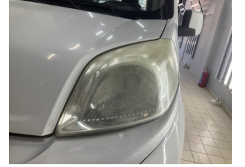
Farlar, Far camı, sol > Deforme Olmuş