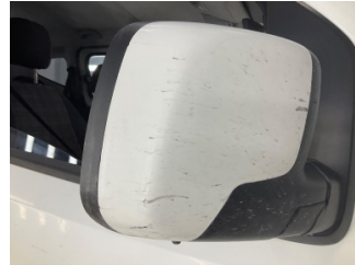
Dikiz aynası, sağ, Dış dikiz aynası kapağı > Çizik