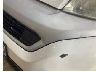
İlave parçalar, ön, Ön panjur > Hasarlı