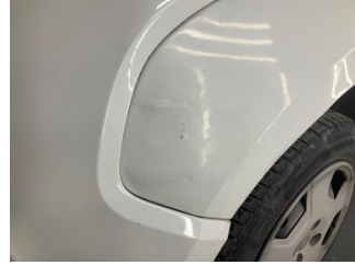
Çamurluk, sol, Çamurluk, sol > Standart Dışı Onarım