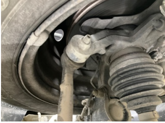
Ön aks, Denge çubuğu, bağlantı cubuğu sağ > Deforme Olmuş