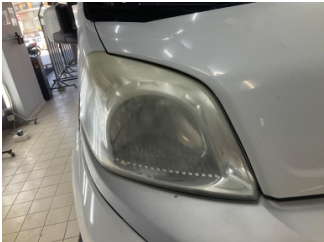
Farlar, Far camı, sağ > Deforme Olmuş