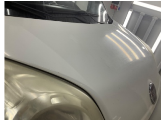
Motor kaputu, Motor kaputu > Etiket Yapıştırılmış