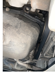
Motor, Motor > Yağ Kaçağı