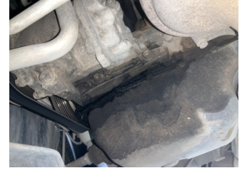
Motor, Motor > Yağ Kaçağı