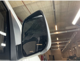
Dikiz aynası, sağ, Dış dikiz aynası cercevesi > Hasarlı