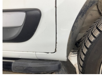
Çamurluk, sağ, Çamurluk, sağ > Boyası Atmış