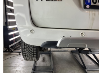
Tampon, arka, Arka tampon > Boyası Atmış