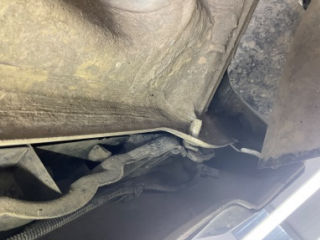
Arka bölüm, Arka sac/panel > Ezik