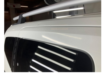
Kaporta, Sağ Üst Frangart > Ezik