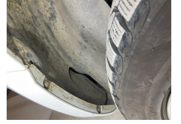
Çamurluk, sol, Davlumbaz > Hasarlı