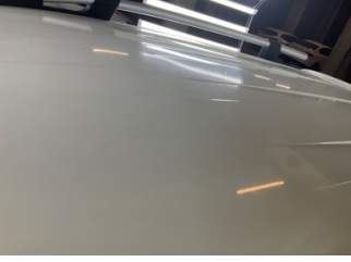
Kaporta, Kaporta > Yakıcı Madde ile Zarar Görmüş

Sayfa: 11/12 Araç Çıkış Tarihi: 22.06.2026 10:52