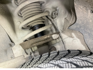
Ön aks, Amortisör körüğü, sol > Yağ Kaçağı