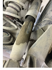
Arka aks, Amortisör, arka sağ > Yağ Kaçağı