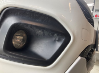
Sis lambaları, Sis Iızgarası Sağ > Kırılmış