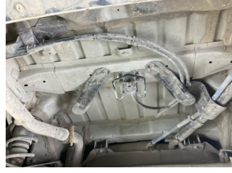
Dokümantasyon ve Ekipmanlar, İstepne > Sökülmüş-Yok