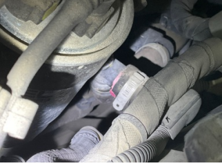
Motorsoğutması, Soğutma sıvısı > Sızdırıyor

Sayfa: 10/12 Araç Çıkış Tarihi: 22.06.2026 10:52