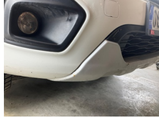
Tampon, ön, Ön tampon > Boyası Atmış