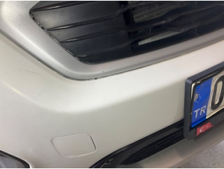
Tampon, ön, Ön tampon > Sabitlemesi Hatalı