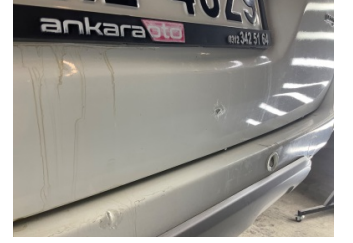
Bagaj kapağı/kapısı, Bagaj kapısı > Boyası Atmış