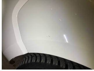
Çamurluk, sol, Çamurluk, sol > Taş Izi