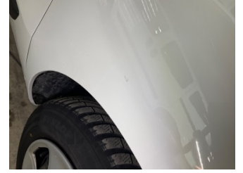
Çamurluk, sağ, Çamurluk, sağ > Noktasal Ezik