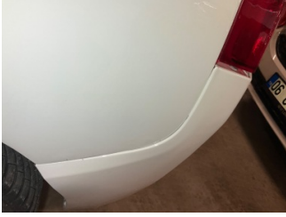
Tampon, arka, Arka tampon > Ayarsız