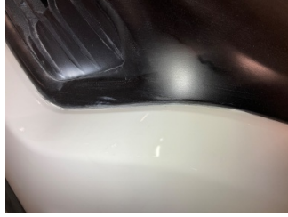
Tampon, ön, Ön tampon > Boyası Atmış