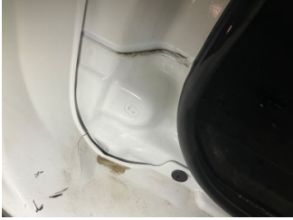
Arka bölüm, Arka sac/panel > Vuruk