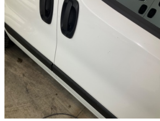
Kapı, sağ ön, Kapı, sağ ön > Taş Izi